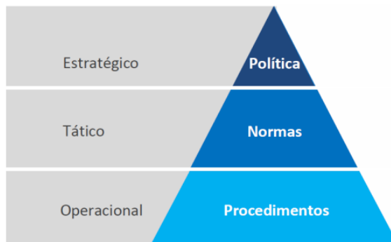
FIGURA 1 - Estrutura Normativa de Segurança da Informação.

c) Procedimentos de Segurança da Informação: estão relacionados ao nível operacional, e têm por finalidade instrumentalizar o disposto nas Normas e na Política, descrevendo os procedimentos a realizar, permitindo a aplicação direta nas atividades do Banpará. Definem como serão implementadas as regras.